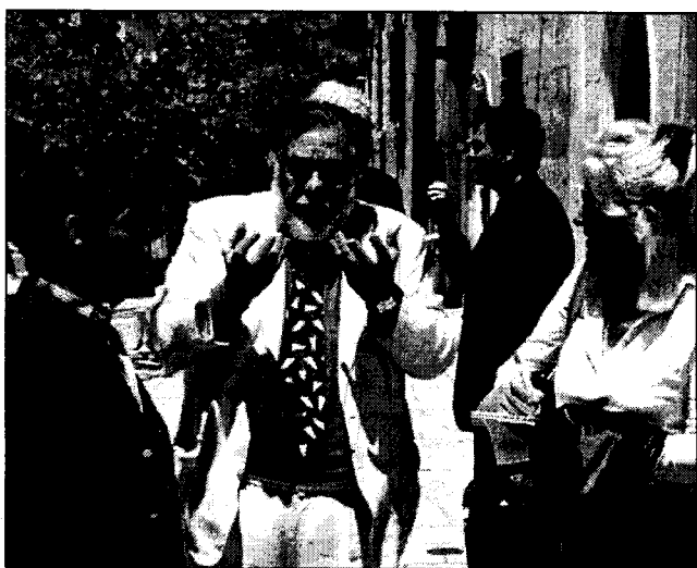
Due momenti della visita di Francis Ford Coppola a Matera

A Matera il regista di "Apocalypse now" ha illustrato il suo progetto del centro sperimentale Coppola avvierà una scuola di cinema Ne è partner la Zoetrope di San Francisco, fondata dal cineasta